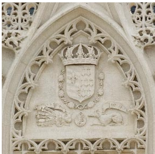
Le blason aux armes d'Anne de Bretagne et de Louis XII Hermines et fleur de lys – lévrier et porc-épic

Anne de Bretagne a été la première à utiliser le château en tant que résidence royale d'occasion, lors de ses visites dans son duché.